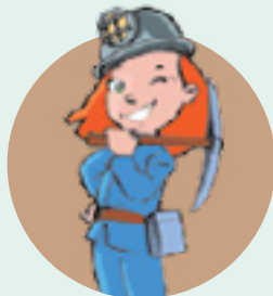
LE PATRIMOINE MINIER