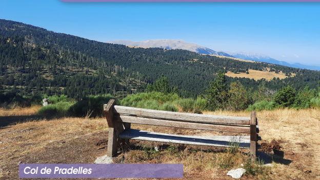
Col de Pradelles