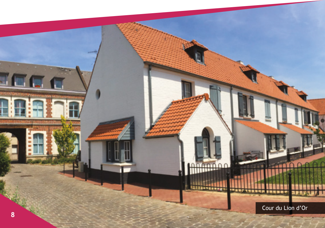
Cour du Lion d'Or

Réservation obligatoire au 03.27.28.89.10