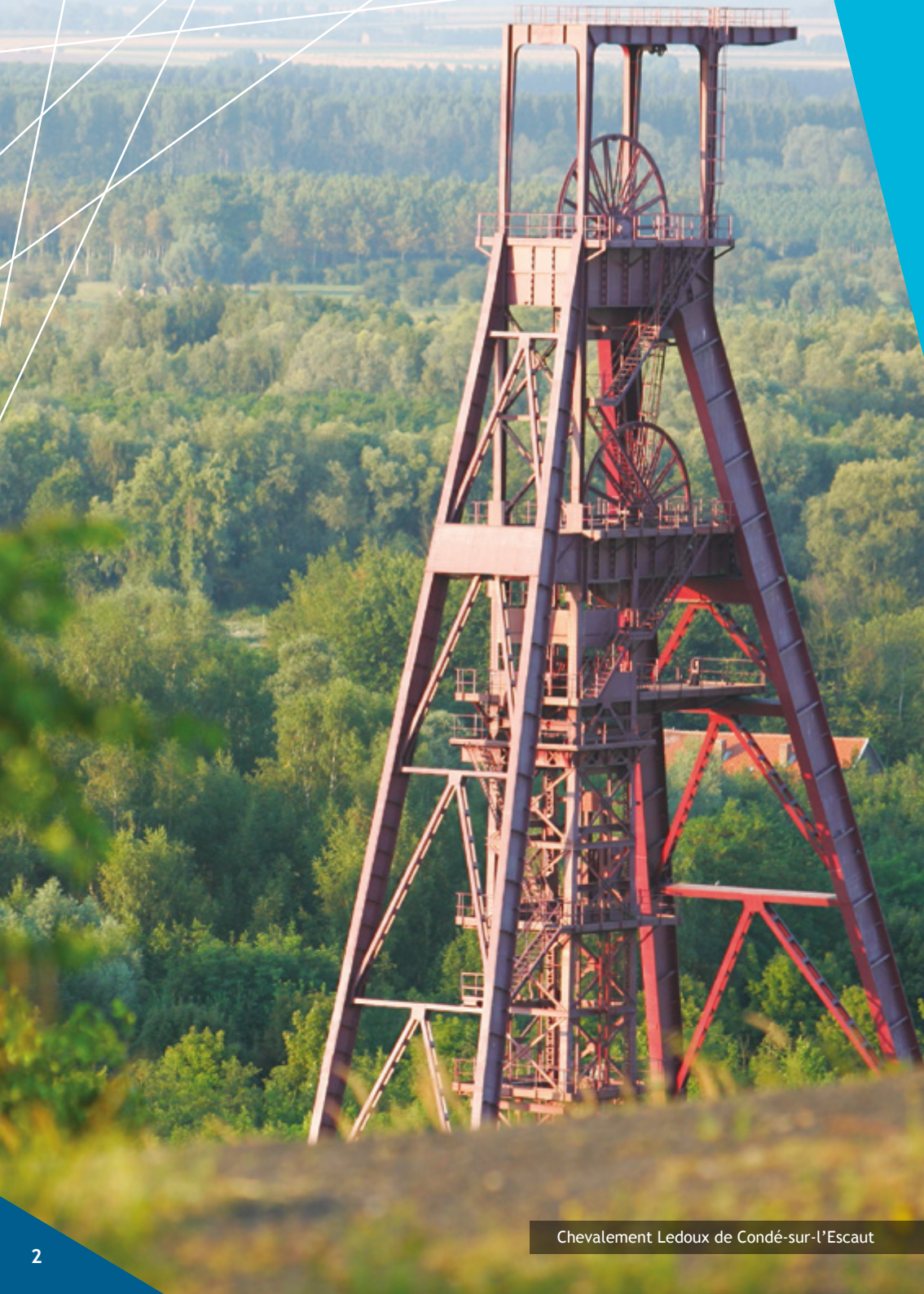
Chevalement Ledoux de Condé-sur-l'Escaut