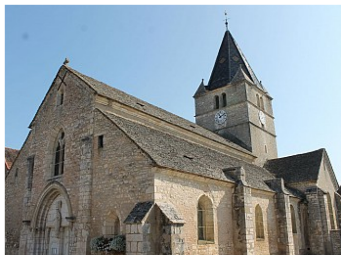
Office de Tourisme Grand Chalons