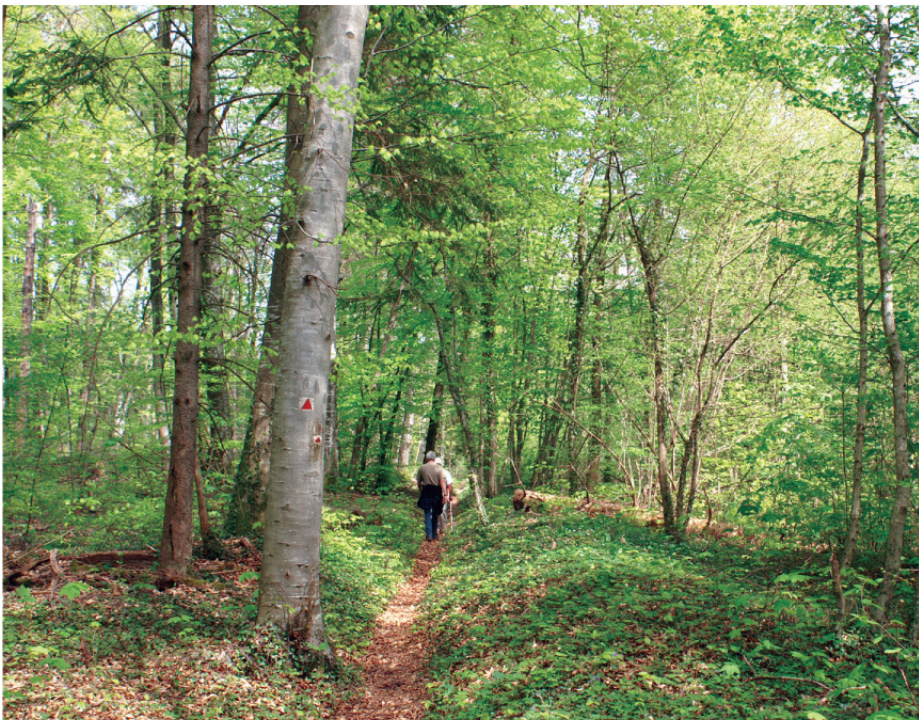
Dans le bois d'Hannonville.

Rejoignez-nous et randonnez l'esprit libre