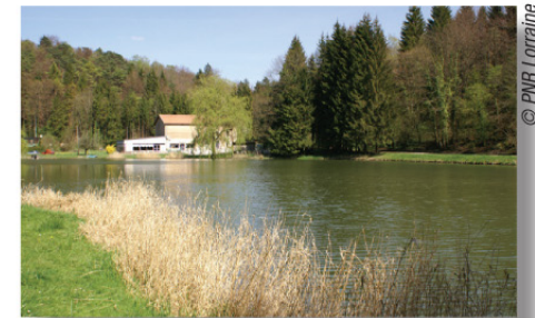
Étang du Longeau.

3 Prendre à droite un chemin creux qui serpente en descendant au fond d'un petit vallon jusqu'aux étangs du Longeau. Au bord de l'eau, tourner à gauche vers la guinguette. Contourner l'étang, revenir par la digue, puis aller à gauche. Poursuivre sur le chemin en fond de vallon jusqu'à la route de Dommartin-la-Montagne à Hannonville-sous-les-Côtes. Emprunter la route à droite, franchir sur un pont le ruisseau du Longeau. Poursuivre sur environ 900 m et, à hauteur d'un virage sur la droite, atteindre un départ de chemin sur la gauche.