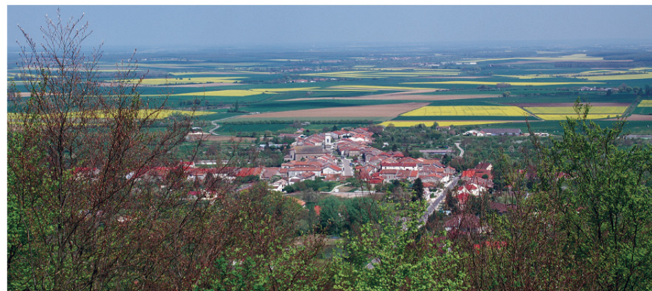
Vue sur Hannonville-sous-les-Côtes.