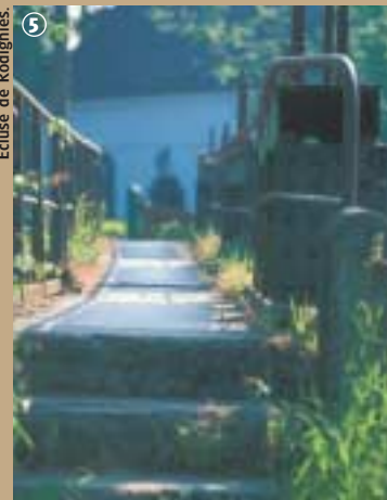
Ecluse de Rodigmes.

Cette activité est tellement ancrée dans l'histoire de la commune qu'un bois privé porte le nom de Bois des Poteries. Les propriétaires y pratiquent la popiculture, c'est-à-dire l'exploitation du peuplier. Ces derniers, alignés en ordre de bataille, contrastent avec le désordre ambiant qui règne chez leurs voisins saule, aulne, chêne et noisetier.