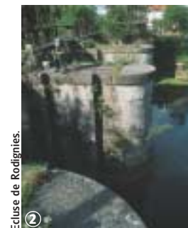
Ecluse de Rodigmes.