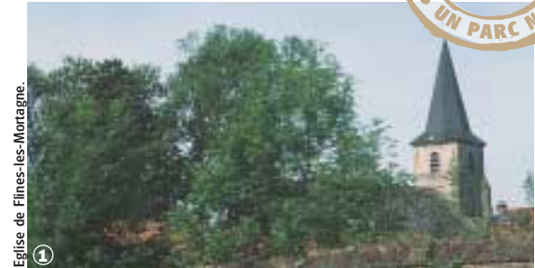
Eglise de Flines-les-Mortagne.

Randonnée Pédestre Circuit des Poteries : 5 km