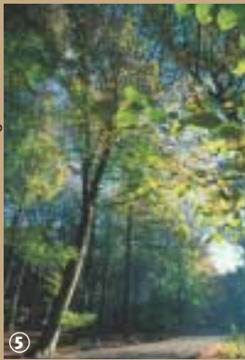
Forêt domaniale de Flines-les-Mortagne.

Cette activité est tellement ancrée dans l'histoire de la commune qu'un bois privé porte le nom de Bois des Poteries. Les propriétaires y pratiquent la popiculture, c'est-à-dire l'exploitation du peuplier. Ces derniers, alignés en ordre de bataille, contrastent avec le désordre ambiant qui règne chez leurs voisins saule, aulne, chêne et noisetier.