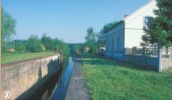
Flines-les-Mortagne, écluse de Rodigmes.

Cette activité s'est transformée en petite industrie, encore florissante au début du XX e siècle. La terre extraite jusqu'à 3 m de profondeur, était brassée dans un moulin, façonnée dans des moules, séchée à l'air libre puis cuite dans des fours. Est-ce étonnant alors d'apprendre que « fline » serait le dérivé latin de « figulinas », traduisez « ateliers de potiers, de tourbes ».