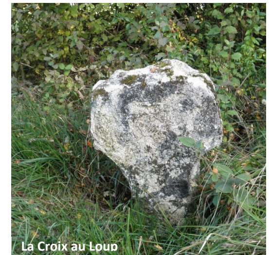
La Croix au Loup

Curiosités: roches de Meuse, points de vue, vestiges de guerre, croix, bornes armoriées, et promenade des Capucins.