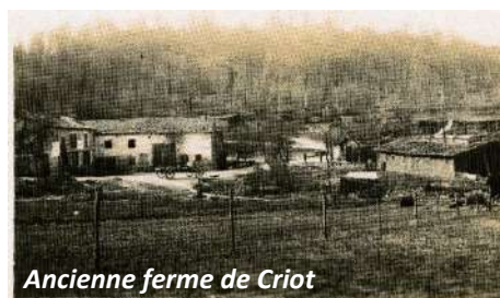
Ancienne ferme de Criot

Après 800 m tourner à droite pour rejoindre, peu après, la route forestière de Marhé. La descendre, franchir la barrière et prendre à droite par la tranchée du Jura. L'horizon se dégage et offre une jolie vue sur la vallée où coule le Rû de Criot.