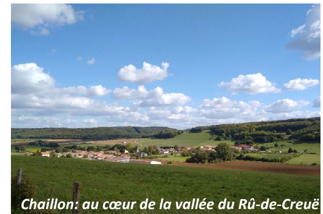
Chaillon: au cœur de la vallée du Rû-de-Creüë

En forêt : ne pas s'écarter du sentier balisé, ne pas camper, ne pas fumer ou faire de feu, ne pas laisser divaguer les animaux, ne pas jeter d'ordures, respecter la faune et la flore et les vestiges de la guerre 14-18. De septembre à février, période de chasse, l'itinéraire est fortement déconseillé. Les mairies sont à votre disposition pour fournir tous renseignements quant aux jours de chasse