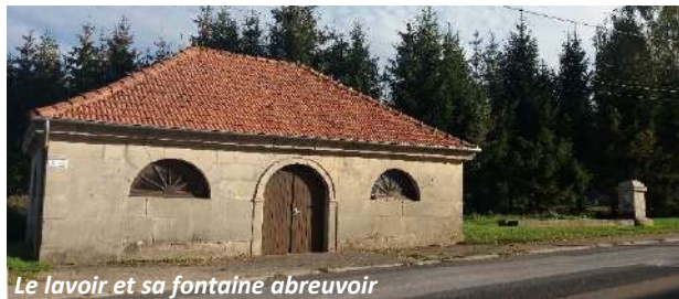
Le lavoir et sa fontaine abreuvoir

Aujourd'hui une activité renaît avec la présence d'une chèvrerie, savonnerie, huilerie, micro-brasserie, viande, légumes, favorisant le commerce en circuit court. Ces producteurs se sont regroupés et commercialisent leurs productions locales dans l'Echoppe à l'entrée du village. Un patrimoine historique demeure cependant : calvaires, ensemble lavoir-fontaine-abreuvoir, fontaines, église (peintures de D. Donzelli), maison des Moines (XVIII ème siècle) qui appartenait aux prémontrés de l'abbaye de L'Etanche (au Nord du village). Un sentier reliait l'abbaye au village puis se poursuivait vers le Sud en direction de l'abbaye de St Christophe (entre Woinville et St Mihiel).