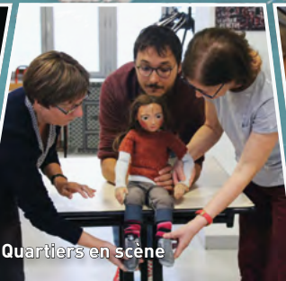
Quartiers en scène