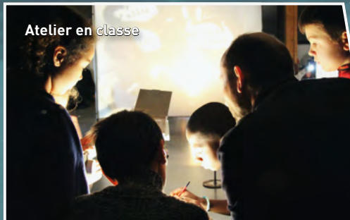
Atelier en classe