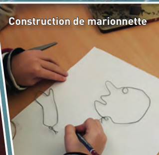
Construction de marionnette