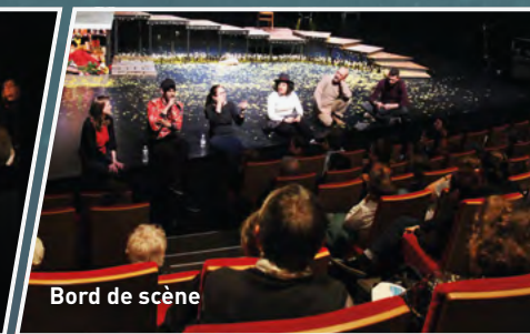
Bord de scène