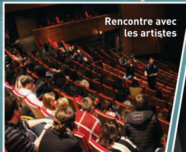
Rencontre avec les artistes