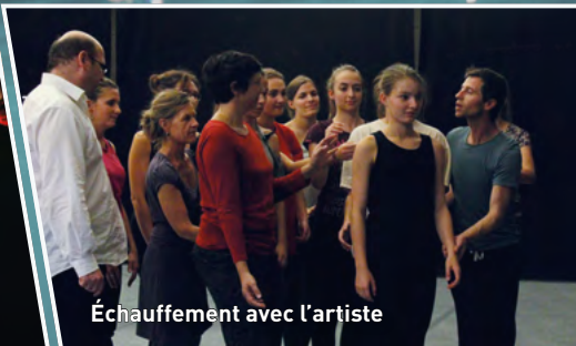
Échauffement avec l'artiste