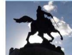
Statue du Maréchal Villars

Partez à la découverte de l'histoire de la ville de Denain à travers ses nombreux cheminements doux, ponctués des divers témoignages de son riche patrimoine historique. Quatre sites miniers sont reconnus au Patrimoine mondial de l'UNESCO