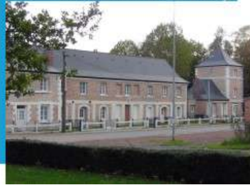
Anciennes écuries et colombiers de l'abbaye

Dans le cadre de la reconnaissance de l'ancien Bassin minier du Nord-Pas-de-Calais au Patrimoine mondial de l'UNESCO, quatre éléments majeurs situés à Denain ont été identifiés dans la liste et sont inclus dans la zone tampon (Fosse Mathilde, terril Renard, coron Chabaud Latour ancien et nouveau). La ville de Denain, en pleine rénovation urbaine, se tourne aujourd'hui vers son avenir.