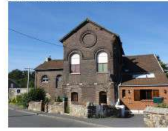
Ancienne Fosse Mathilde - UNESCO