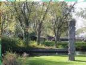
Terril Renard - E.N.S. - UNESCO