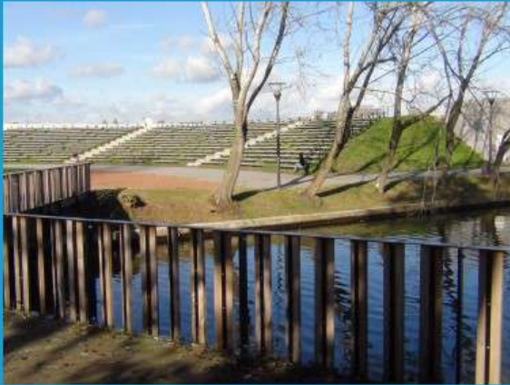
Amphithéâtre de verdure - Parc Enfle-Escaut

Denain, Histoire d'eau, de charbon, d'acier, d'avenir