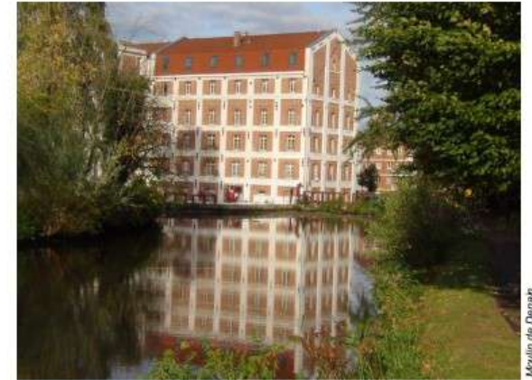
Moulin de Denain