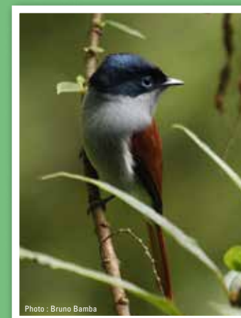
Oiseau la vierge Terpsiphone bourbonnensis Protégé par arrêté ministériel