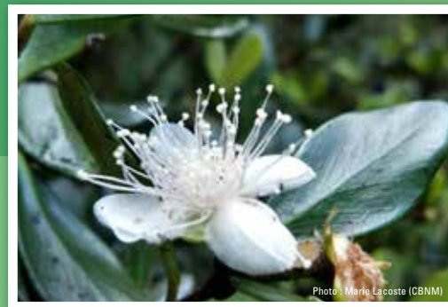
Bois de nêfles Eugenia buxifolia