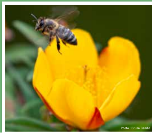
Fleur jaune Hypericum lanceolatum