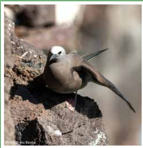
Macoua Anous stolidus

Certaines de ces espèces sont endémiques de La Réunion