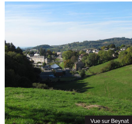
Vue sur Beynat