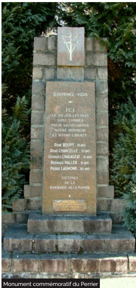
Monument commémoratif du Perrier