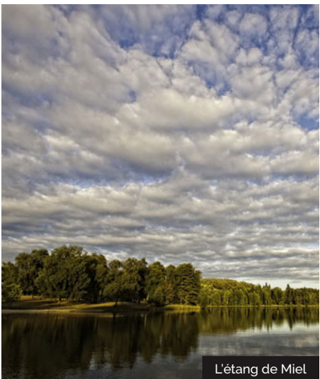
L'étang de Miel