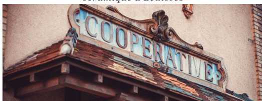
EXEMPLE D'ORNEMENT CÉRAMIQUE

Ancienne demeure bourgeoise construite entre 1869 et 1890 par les Perrusson, propriétaires de l'usine de céramique d'Écuisses