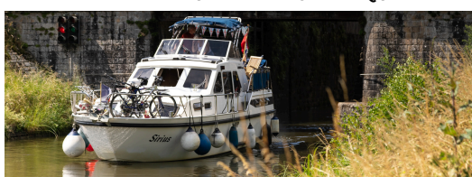
BATEAU DE PLAISANCE SUR LE CANAL