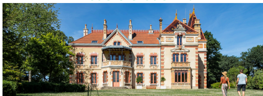
LA VILLA PERRUSSON