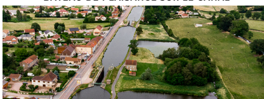
LES SEPT ÉCLUSES

À l'origine, cette échelle était constituée de 7 écluses. Leur nombre a été réduit à 4 lors du passage au gabarit Freycinet.