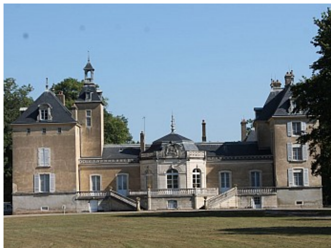
Office de tourisme du Grand Chalon