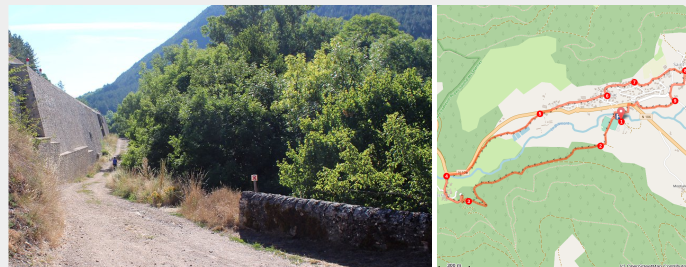
Chemin de randonnée après le village des Fonts

Cet itinéraire court le long du Bramont et de ses affluents dont la Nize. Vous y découvrirez la façon dont nos anciens ont domestiqué la force des rivières grâce au vieux moulin de Cénaret et au système du "béliet hydraulique" au village des Fonts ("les Fontaines" en occitan).