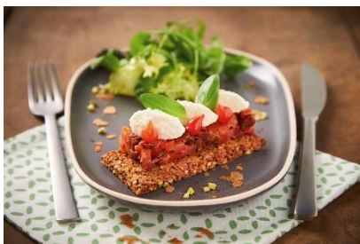
Lingot tomates et mousse mozzarella basilic