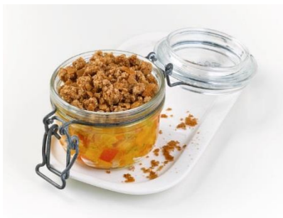
Crumble Pêche abricot