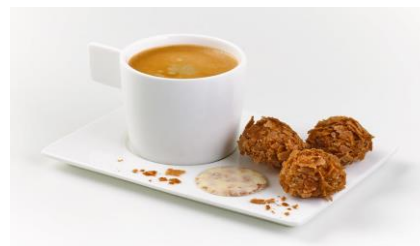
Croquettes au caramel fleur de sel