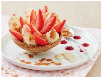
Tarte aux fraises