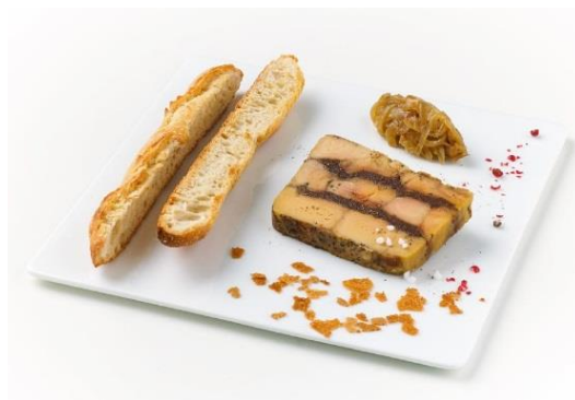
Marbré de foie gras de canard, croustillant d'éclats de crêpe dentelle parfumé au pralin