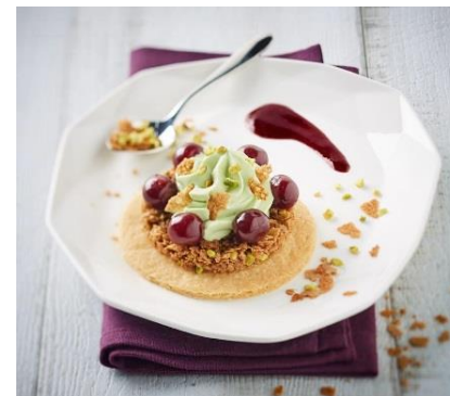
Sablé croquant pistache cerises Amarena