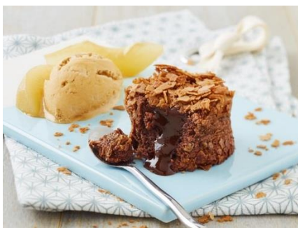
Coulant au chocolat