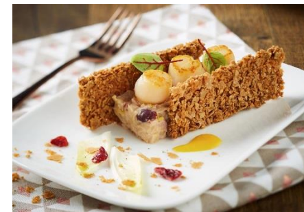
Noix de Saint Jacques et fondue d'endives, crackers d'éclats de crêpe dentelle et galette de blé noir