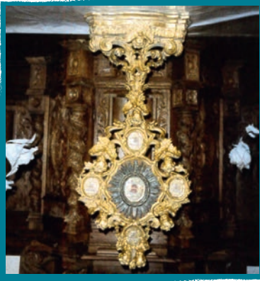
Remarquable Monstrance dorée à l'or fin

Sur la droite du portail Ouest de l'église, on remarque une pierre de Templiers portant leur signe. « Templiers » est un ordre religieux et militaire international issu de la chevalerie chrétienne du Moyen-Âge.