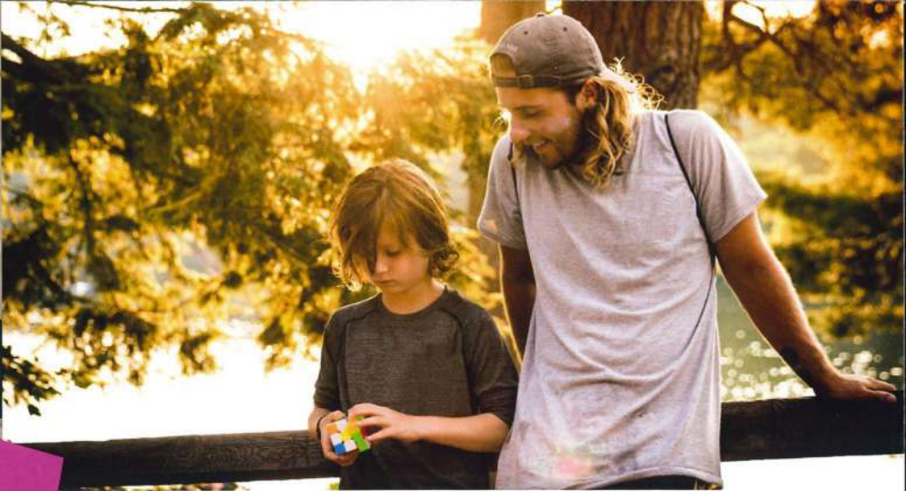
Garde d'enfants de plus de 3 ans, surveillance scolaire, aide aux devoirs...