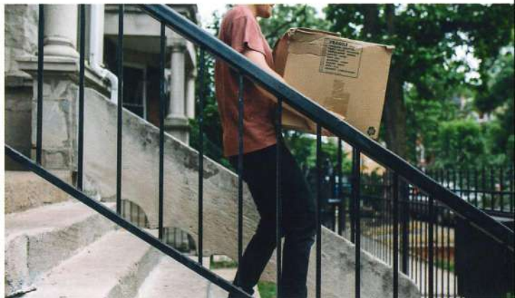
Manutention - Aide au déménagement

Ainsi, les salariés acquièrent une expérience professionnelle grâce à des missions ponctuelles ou régulières, dans des domaines variés.