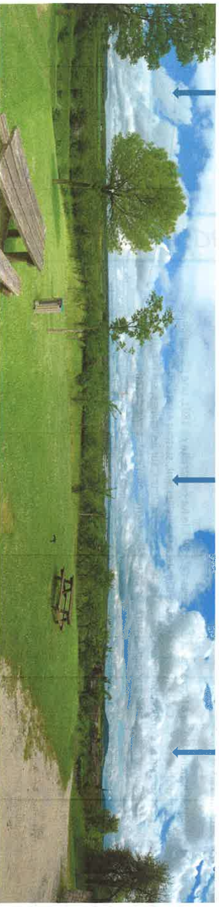
Lac de Madine Nonsard