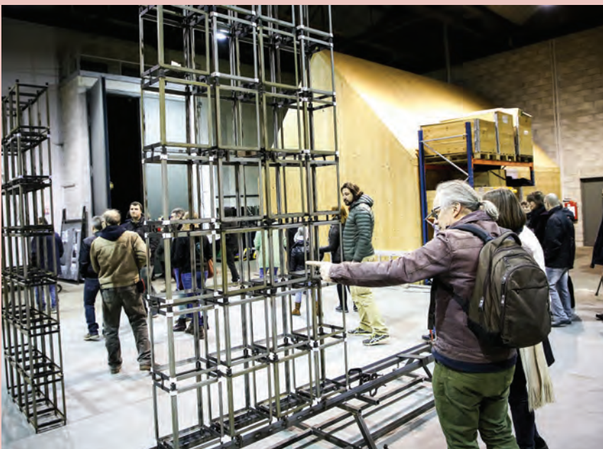
Cie Carabosse - Par les temps qui courent