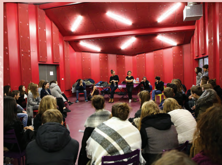
Cie Les Fugaces - Vivants