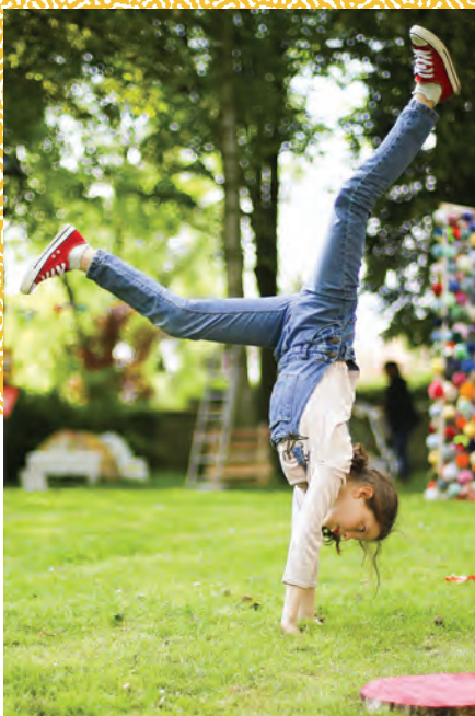
The Color Of Time - Cie Artonik

La 21 e édition se tiendra au Boulon et à Vieux-Condé du 3 au 5 mai 2019 !