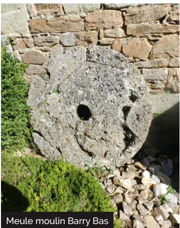
Meule moulin Barry Bas