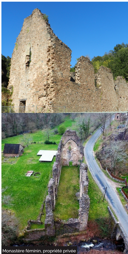
Monastère féminin, propriété privée

Embarquez vos randonnées en téléchargeant l'appli Vallée de la Dordogne - Tour sur iPhone, l'iPad et l'iPod touch