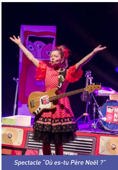
Spectacle "Où es-tu Père Noël ?"

Venez en famille découvrir le monde du spectacle, chacun des deux concerts sera suivi d'une présentation des métiers du