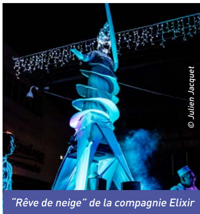
“Rêve de neige” de la compagnie Elixir