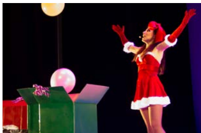
La patinoire • Samedi 4 décembre

Boutique éphémère de créateurs au 5/7 rue Porte-Côté.