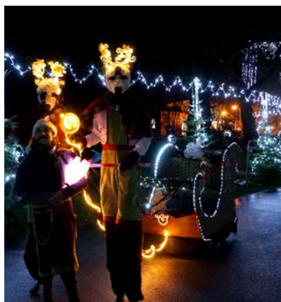
La grande parade de Noël