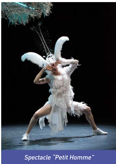
Spectacle "Petit Homme"