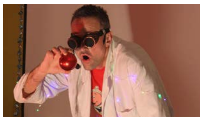
Spectacle "La Folle vadrouille de Noël"