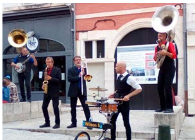
Fanfare Les Wilson 5

Parvis Danielle Mitterrand et Maison de Bégon