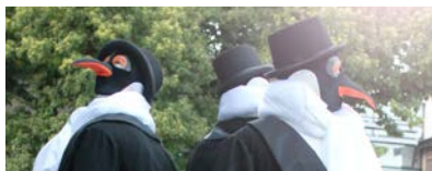
Le show dément des manchots

▶ À partir de 17h - Rendez-vous dans la cour du Château royal (distribution de lampions)