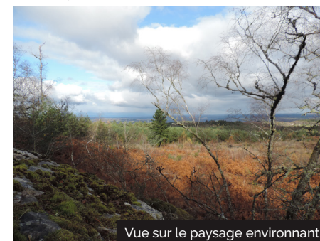
Vue sur le paysage environnant

Petit conseil : après votre balade visitez le joli bourg d'Auriac, profitez de son plan d'eau ou bien encore découvrez les Jardins de Sothys, jardin remarquable.