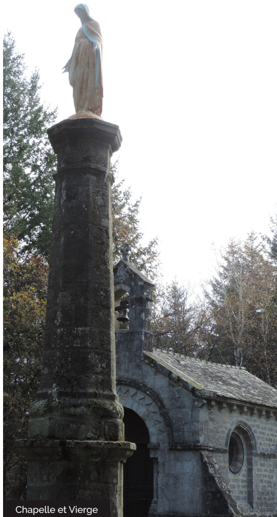
Chapelle et Vierge

Un petit livret est disponible à la mairie d'Auriac et à l'Office de Tourisme d'Argentat.