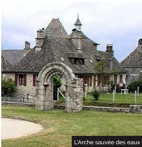
L'Arche sauvée des eaux