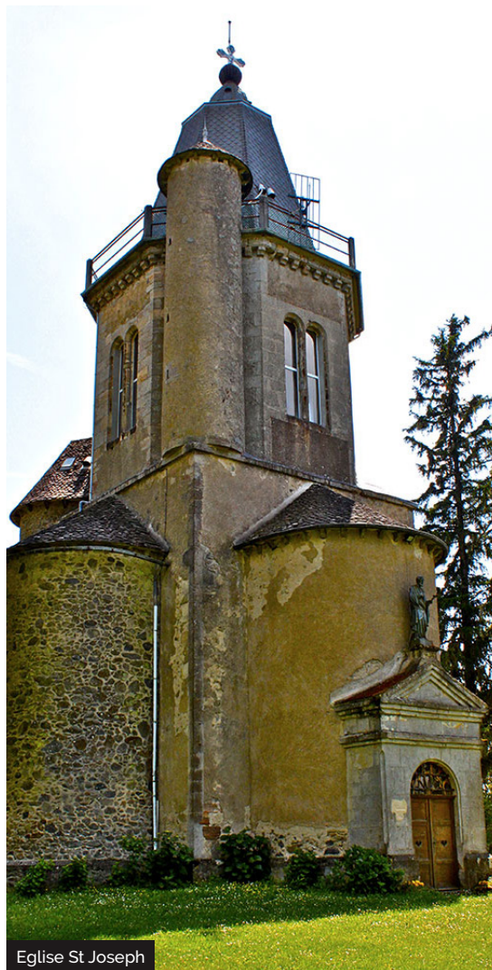
Eglise St Joseph

Une chapelle fut édifée à l'initiative d'un curé à partir de 1873, sur le Mont Saint-Joseph, au-dessus du village de Lagineste. Le pèlerinage diocésain annuel, inauguré en 1881, fut très fréquenté, surtout lors de la fête de Saint Joseph, patron des ouvriers. Ce pèlerinage correspond à un regain de dévotion au XIXe siècle pour Joseph et la Vierge considérés par l'Eglise comme les modèles de la vie chrétienne. Le pape Pie IX proclame Joseph, patron de l'église catholique en 1870 et fixe sa fête au 19 mars. En 1955, le pape Pie XII institue une seconde fête dédiée à Joseph le Travailleur, le 1er mai, jour de la fête du travail. La chapelle est la seule partie réalisée d'un projet monumental.