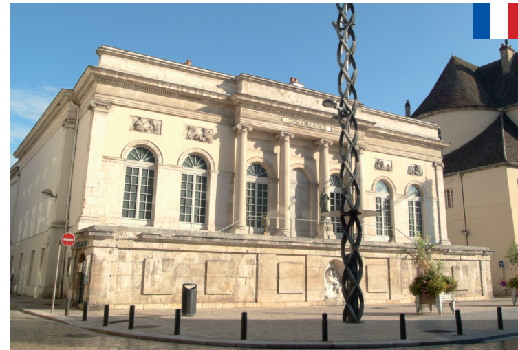
www.studiocomedial.com Impression SEC