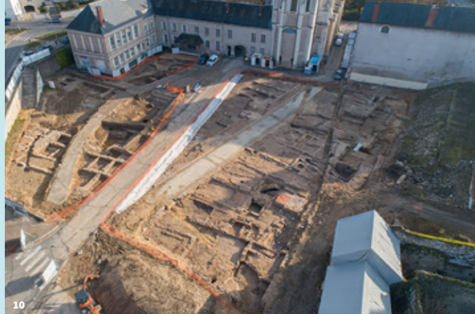
10. Chantier de fouilles à l'emplacement du futur Carré Saint-Vincent