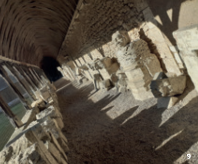
9. Musée lapidaire