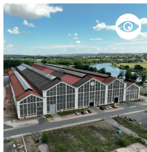
FONDERIE HENRI-PAUL Nommée ainsi en mémoire du fils d'Eugène II Schneider, mort au combat en 1918.