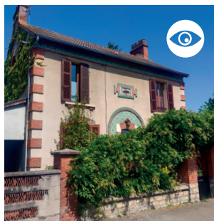
MAISONS CÉRAMIQUES du quartier de la gare.