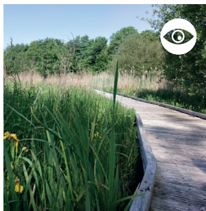
MARAIS DU PONT DES MORANDS