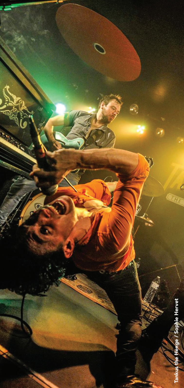
Tankus the Henge / Sophie Hervet