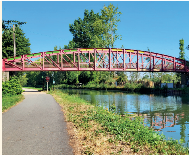
© Communauté d'Agglomération de Béthune-Bruay, Artois Lys Romane