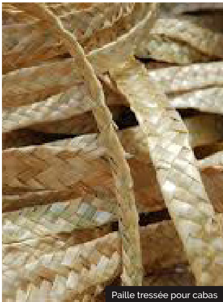
Paille tressée pour cabas