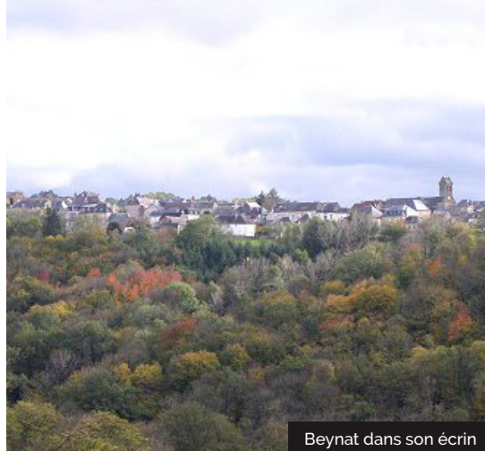
Beynat dans son écrin