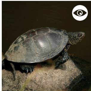
LA CISTUDE D'EUROPE Tortue aquatique méditerranéenne et occidentale en déclin dans de nombreux pays européens.