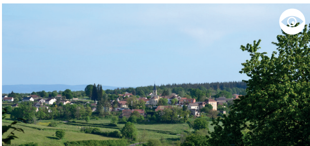
VUE DU VILLAGE DE POUILLOUX