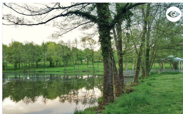
PARC DES MIRAUDS