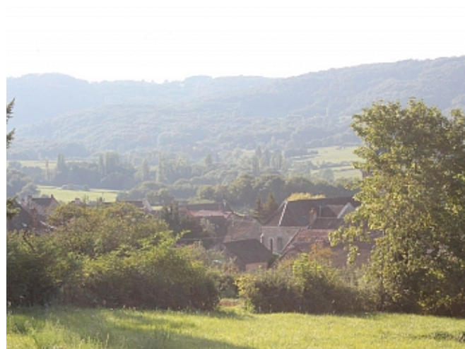
Office de tourisme du Grand Chalonnais