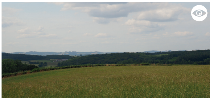
POINT DE VUE SUR LE HAMEAU DE VERSIGNY