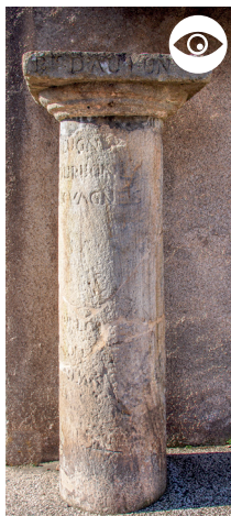
BORNE DIRECTIONNELLE ANCIENNE