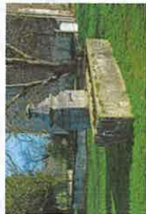
> église Saint Hubert