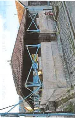
> lavoir - abreuvoir