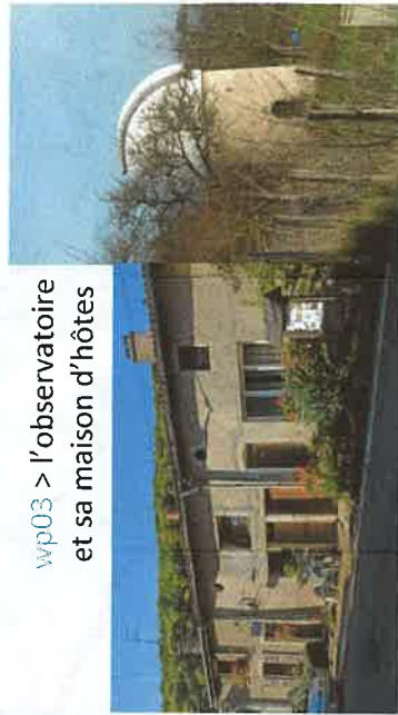
wp03 > l'observatoire et sa maison d'hôtes