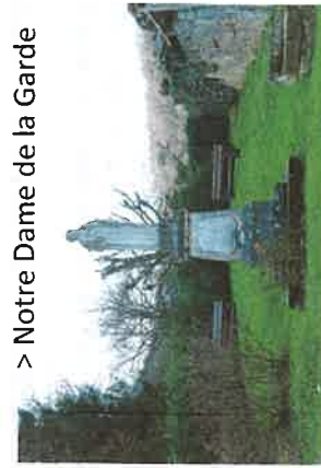
> Notre Dame de la Garde