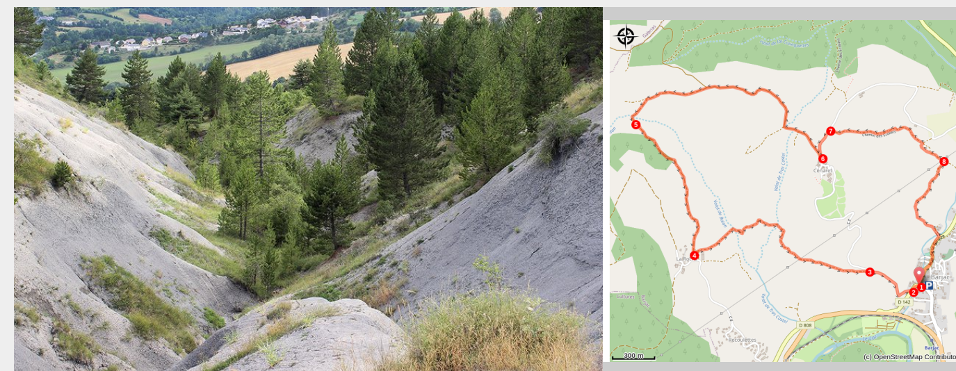
Marnes Bleues - Falaises de Barjac (OTI Mende)

Ce circuit au départ de Barjac, vous fera grimper sur un causse. Vous y traverserez des "valats", vallons plus ou moins marqués entaillant les versants et les hameaux de la Roche et du Cénaret.