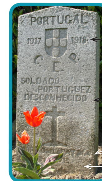
Tombe d'un soldat inconnu