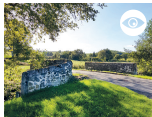
PONT DE LA GUETTE