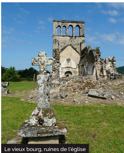
Le vieux bourg, ruines de l'église