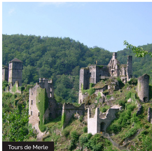
Tours de Merle

Embarquez vos randonnées en téléchargeant l'appli Vallée de la Dordogne - Tour sur iPhone, l'iPad et l'iPod touch