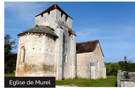
Eglise de Murel

Le Vignon est un ruisseau, affluent de la Tourmente, qui prend naissance à l'Œil de la Doue, émergence dans la falaise du Causse, au pied de Murel. A l'époque c'est une frontière naturelle entre la Vicomté de Turenne et la baronnie de Cazillac. Les moulins sont souvent bâtis sur 2 terres, comme ici, un pied à Murel, l'autre à Cazillac. Le moulin de Murel bâti au Xème siècle par des moines puis annexés par les seigneurs, il est abandonné à la Guerre de Cent ans. Il est ensuite repris par une nouvelle génération de meuniers jusqu'à l'arrivée des minoteries pour s'arrêter en 1937.