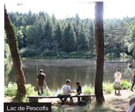
Lac de Pescofis

Elle se compose en majeure partie de résineux, lieu d'activités : chasse, pêche, cueillette de champignons, randonnées et exploitation sylvicole. En collaboration avec l'ONF, cette forêt publique certifiée PEFC est gérée durablement par un schéma d'aménagement (2013-2032). Autrefois, c'était dit-on la plus grande forêt du Quercy, détruite pendant la Révolution Française, Pendant la dernière guerre mondiale, de nombreux maquisards occupaient cette forêt. En 1944, 90 officiers et sous-officiers, français et étrangers, ainsi que 80 tonnes d'armement et d'explosifs y ont été parachutés (le plus gros largage de toute la zone sud).