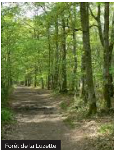
Forêt de la Luzette