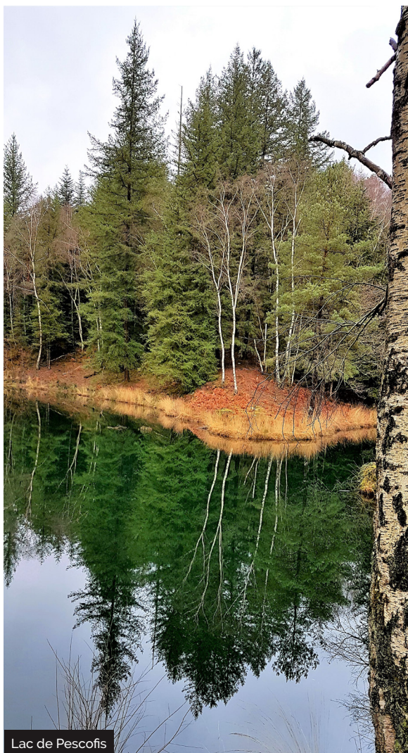
Lac de Pescofis

Embarquez vos randonnées en téléchargeant l'appli Vallée de la Dordogne - Tour sur iPhone, l'iPad et l'iPod touch