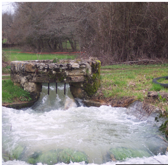
Source du Vell