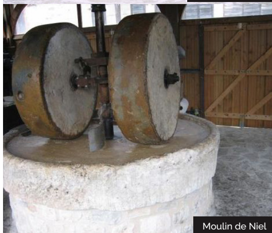
Moulin de Niel

Embarquez vos randonnées en téléchargeant l'appli Vallée de la Dordogne - Tour sur iPhone, l'iPad et l'iPod touch