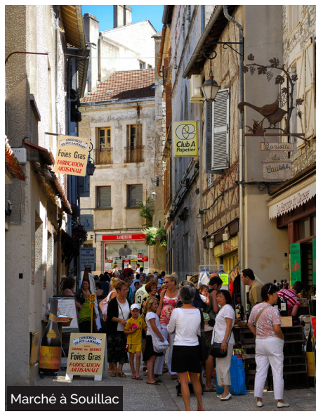
Marché à Souillac

6 Quitter le chemin de castine pour prendre à gauche un sentier peu visible dans la prairie afin de rejoindre l'ancien chemin descendant vers le viaduc. Belles vues sur les viaducs de Souillac et de Lamothé. Descendre un chemin pentu pour rejoindre la rue du Dragon. La rue se transforme en sentier. Passer sous la 1ère arche du viaduc, puis rejoindre la gare par la rue du Dragon.