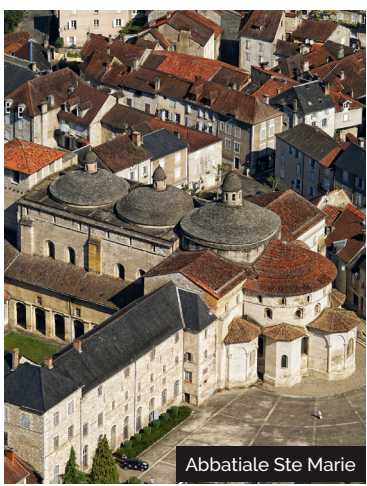
Abbatiale Ste Marie