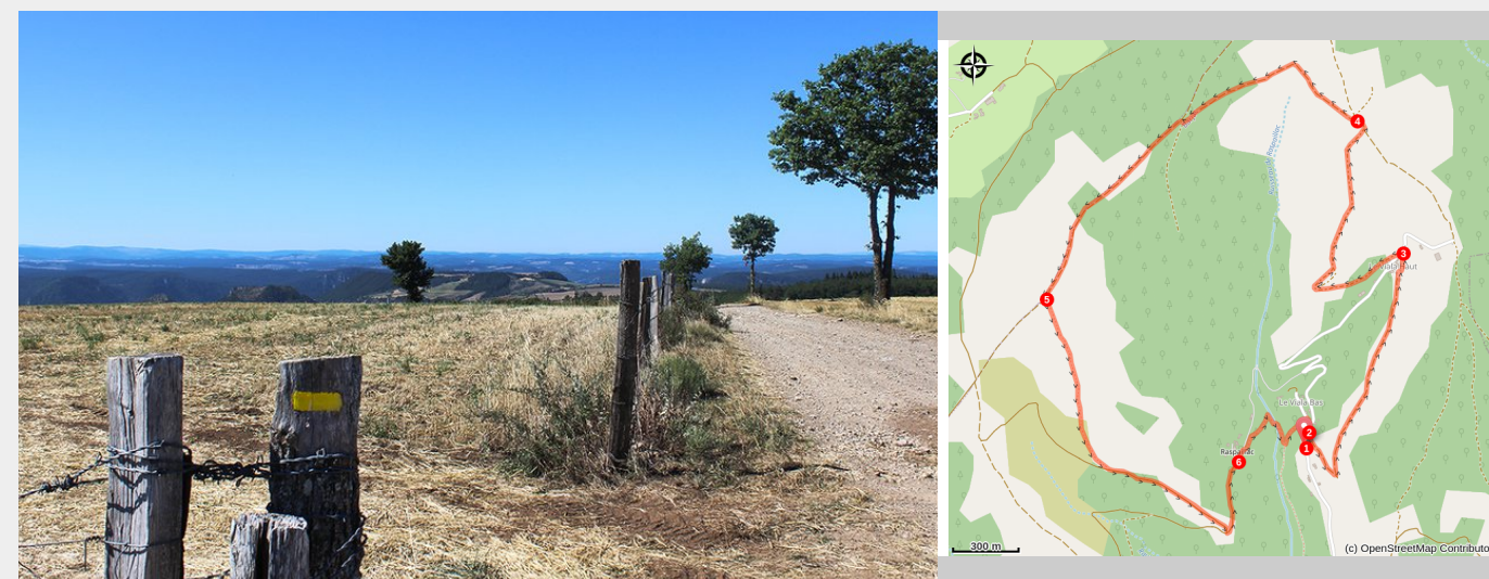
Vue sur le Sud-Ouest depuis la draille de la Boulaine

Ce circuit chemine sur le flanc exposé au sud de la Montagne de la Boulaine, ancien massif de roches métamorphiques, des micaschistes, au contact entre granite de la Margeride et calcaire des Causses.