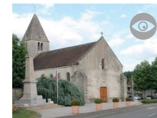
■ L'ÉGLISE SAINT-ÉTIENNE datant du XI e siècle.