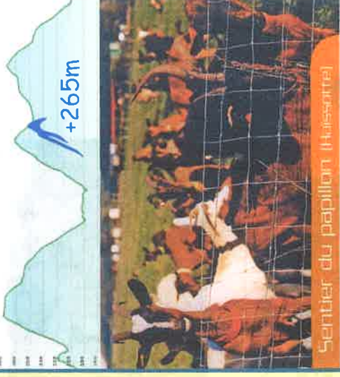
Sentier du papillon (Haisortel)

Haisotte est le nom d'un bois de Creuë, au relief particulièrement tourmenté. Idéal pour les bons grimpeurs, mais il faut du souffle. Par contre, le profil général du circuit est équilibré, peu de plat mais des côtes digestes, de beaux paysages, surtout du côté de l'Abbaye.