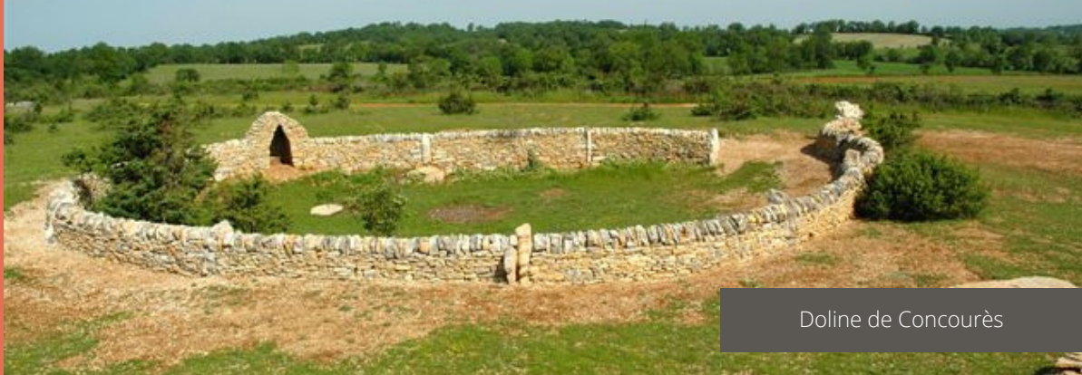
Doline de Concourès