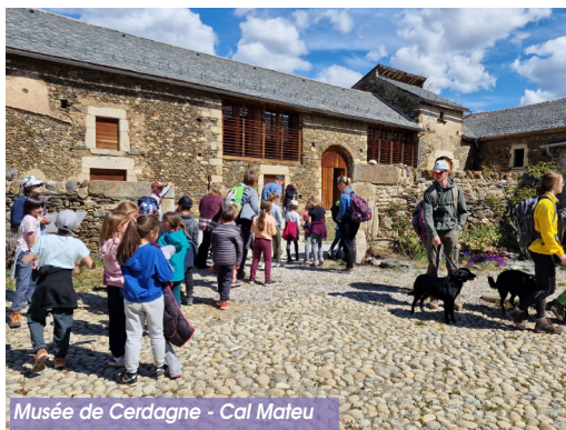
Musée de Cerdagne - Cal Mateu

A côté de ce musée d'arts et traditions populaires, vous verrez la vigne la plus haute d'Europe. L'église est intéressante pour la beauté de ses retables datés du XVI e siècle.