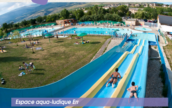
Espace aqua-ludique Err