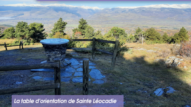
La table d'orientation de Sainte Léocadie