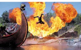
Le Grand Parc du Puy du Fou Billetterie à la réception