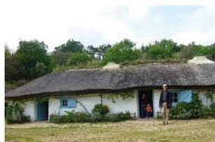
La Bourrine du Bois Juquaud

LE CAMPING DOMAINE DES SALINS EST ENGAGÉ DANS UNE DÉMARCHE ENVIRONNEMENTALE À TRAVERS PLUSIEURS ENGAGEMENTS AU QUOTIDIEN :